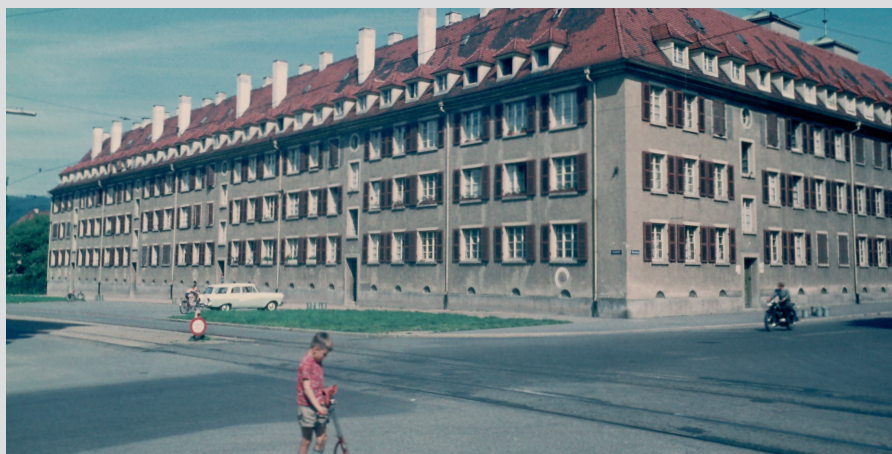
Die Familienheime im Karree Rennweg/Komturstraße in den 50er Jahren

Die 49 geplanten Wohnungen sowie zwei Gewerbeeinheiten werden über einen zeitgemäßen Komfort verfügen. Das bedeutet: ein aktueller energetischer Standard, ansprechende Grundrisse, Balkone, Schall-